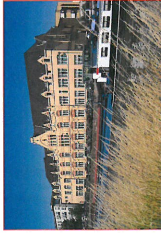
Campus H. Hart