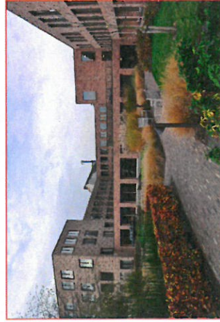
Campus Kloosterhof Pamele